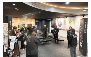
エクスカージョン