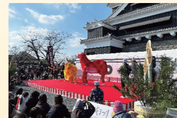
新町獅子舞保存会