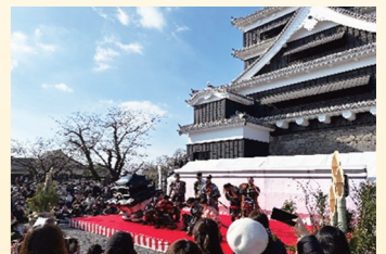
ひごまる隊・熊本城おもてなし武将隊