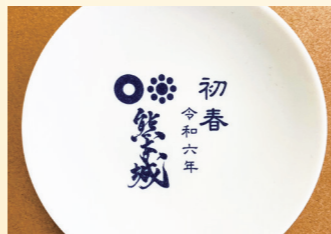
かわらけ ※写真はイメージです。