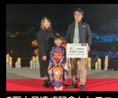
2万人目達成記念セレモニー