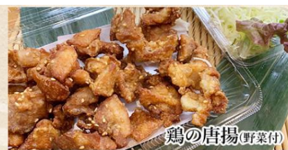
鶏の唐揚げ(野菜付)