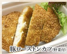
豚ローストンカツ(野菜付)