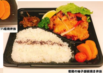
若鶏の柚子胡椒焼き弁当