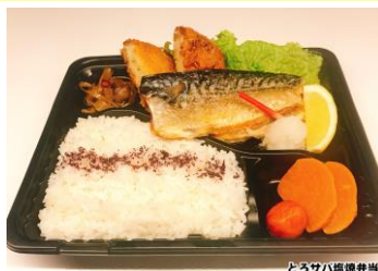
とろサバ塩焼弁当