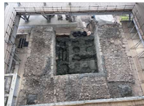
宇土櫓素屋根内部 (写真は3月時点)